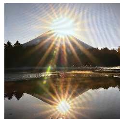
【2026 年元旦富士山初日の出】

本年も、子どもたちが安心して学び、成長できる学校づくりに教職員一同努めてまいります。引き続き、本校の教育活動へのご理解とご協力を賜りますよう、よろしくお願い申し上げます。皆様のご健康とご多幸を心よりお祈り申し上げます。