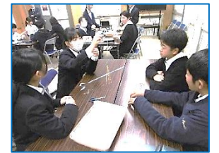
【マシュマロチャレンジ】

研修会では、「リーダーに必要なこと」について考えるとともに、企画・運営力を高める活動を行い、専門委員会ごとに年間活動計画の作成などに取り組みました。よりよい芦屋中学校をつくっていかうという強い思いが随所に感じられ、話し合いの場面では活発で真剣な意見交換が行われていました。