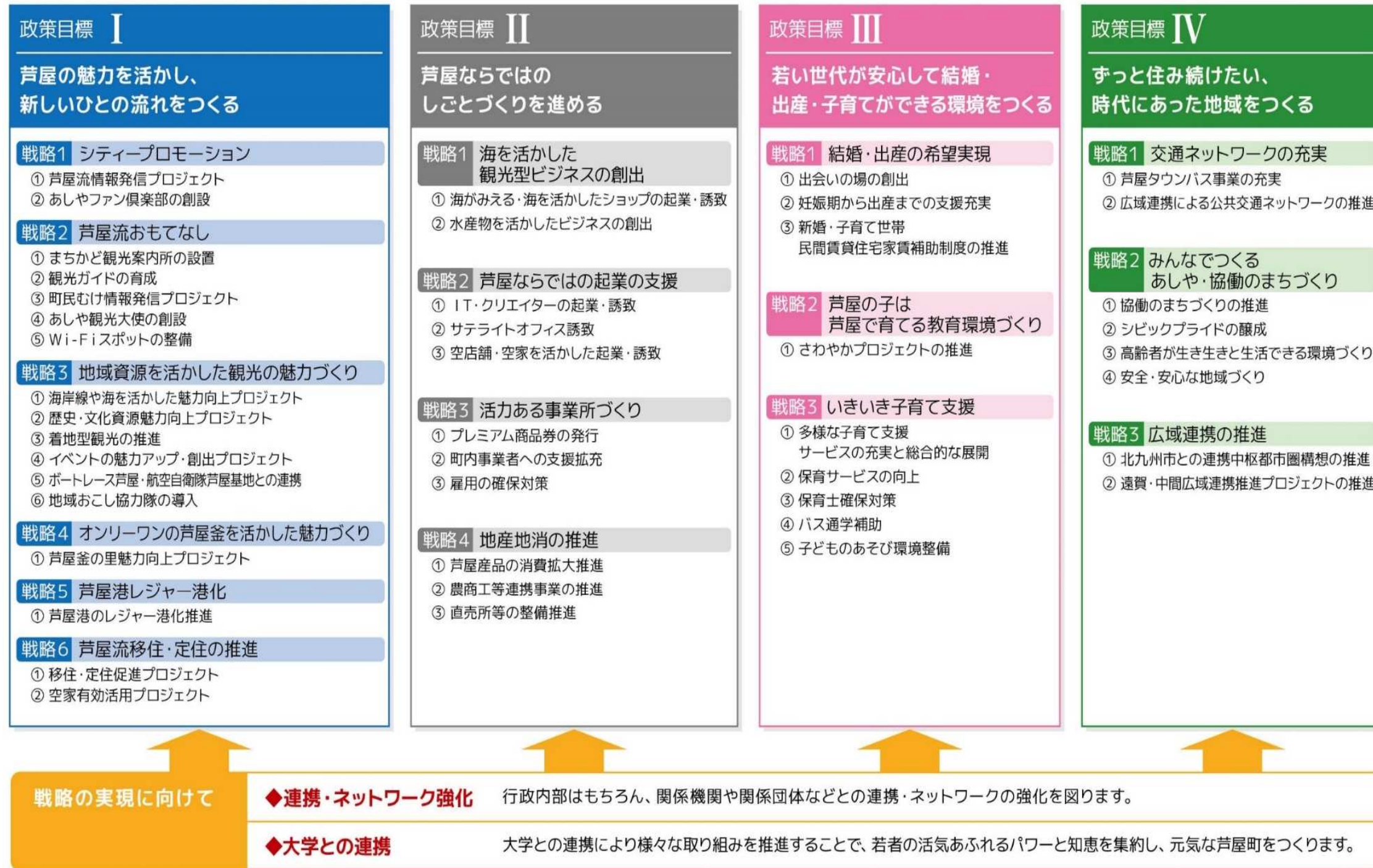
第1期総合戦略体系図

なお、人口ビジョンは、国及び県の動向を踏まえ、令和2年度に改訂の必要性について検討します。