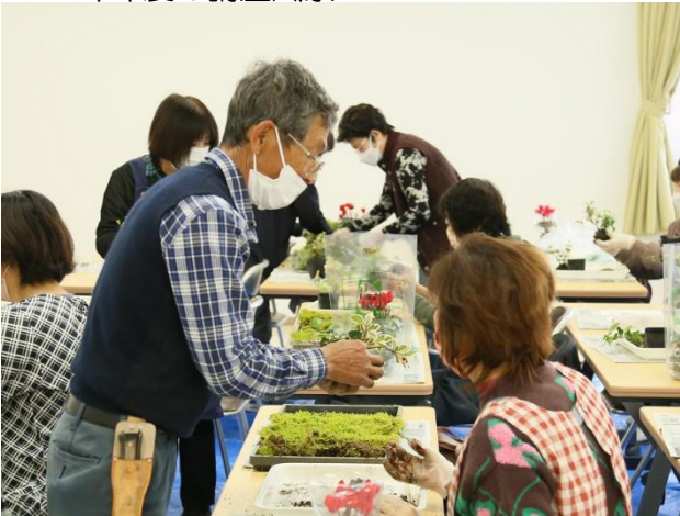
昨年度の講座風景

野山に咲く草花を使って自分流の苔玉を作ります。苔玉は、2種類作る予定です。玄関や居間に自分で作った苔玉で彩りを添えられてはいかがでしょうか？！