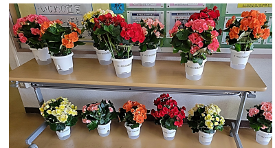
東小校区育成会からの祝花

子どもたちへの心温まるお心遣いにお礼申し上げますとともに、日頃から東小学校を支えていただいていることに心から感謝申し上げます。ありがとうございました。