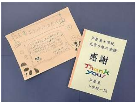
お渡ししたお礼の手紙集

子どもたちのために、1年間ご尽力くださりありがとうございました。心から感謝申し上げます。今後もよろしく願い致します。