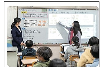
芦屋町立芦屋東小学校（福岡県）

本校HPトップ画面の「新着情報（2023年3月14日更新）」をクリックしていただきますと、詳しい内容がご覧いただけます。