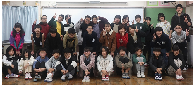
よりよい学校づくりに尽くしてくれた6年生

17日（金）は、第49回卒業証書授与式の日です。この一年間、「みんなが思いやりの気持ちをもって協力し合い仲を深められる、一人一人がルールを守って安全・安心に過ごせる学校」づくりを目指し、児童会や委員会活動に率先して取り組み、東っ子いじめ0宣言や芦屋中との合同挨拶運動、縦割り班集会活動、コロナ予防週間など、様々な活動に取り組みました。そのおかげで、目指す学校の姿に近づくことができました。