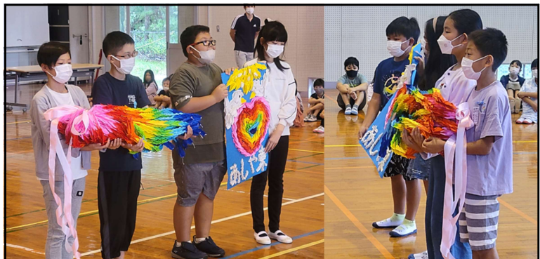
全校で折った鶴を千羽鶴にまとめ、6年生に渡す様子