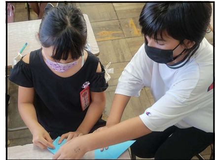
鶴の折り方を教える様子

また、全校のみんなで折った鶴は、5年生が千羽鶴としてまとめ、9月20日（火）の「平和をつくる会」で、6年生に渡しました。なお、この会は昨年度まで「平和を願う会」として行っていましたが、平和は願うだけでなく、「自分たちがつくっていくものである。」という考えから、集会委員会が「平和をつくる会」と名を変更しました。この鶴は、6年生が修学旅行で長崎の「平和公園」に献鶴することとしています。