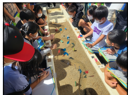
流れる水のはたらきを観察する様子