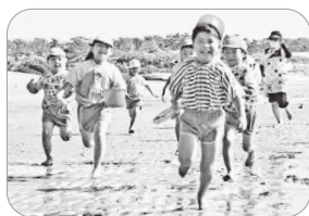
愛生幼稚園 海遊び