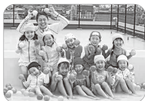
芦屋中央幼稚園 プール遊び

認定こども園芦屋中央幼稚園(☎222局0327) 愛生幼稚園 (☎223局0358)