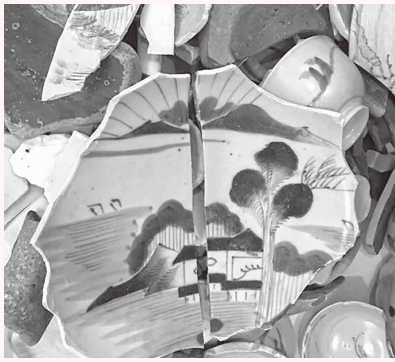
△浜に打ち上げられた陶器片

特に台風10号の鹿児島県や長崎県での風雨の激しさは凄まじく、海岸での実況は身の危険を視聴者へダイレクトに伝えていました。この暴風と碎け散る波濤を見たとき、筆者の脳裏に浮かんだのが、芦屋から岡垣につながる海岸線の浜に時折打ち上げられる、江戸時代の陶器片