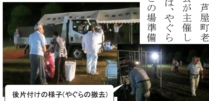
後片付けの様子(やぐらの撤去)