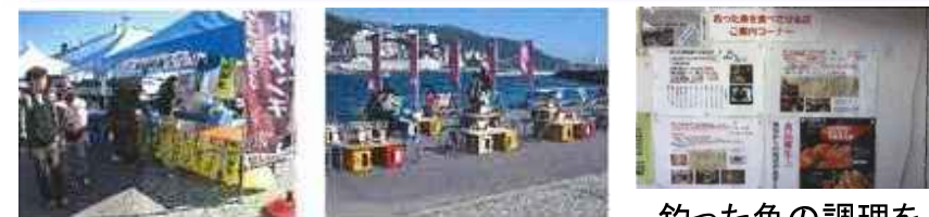
おさかなフェスティバル