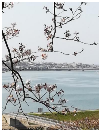
→江川台登り坂から桜越しに撮影した遠賀川

町民会館の2階の窓から城山が見えます。開花の季節になると山が少しずつピンク色に変わります。毎日景色を見るのが楽しみです。遠くから眺めるのもまたきれいです。今年、町民会館が改修工事のため、窓から眺めることはできませんので、歩いて散策してみたいと思います。