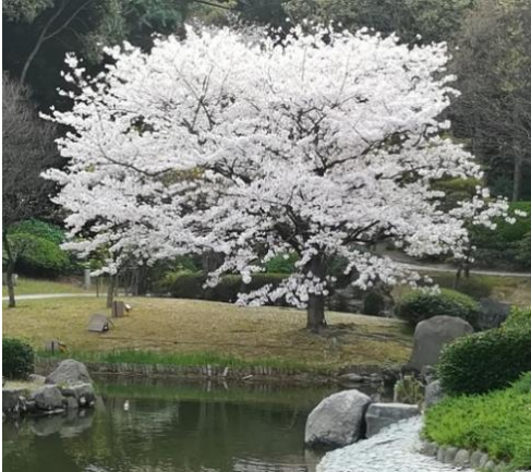
茶室から見える桜↑ ↓池に映る夜桜

河津桜から始まって、ソメイヨシノや山桜など次々に咲きます。池に映る一本桜が素敵で、夜桜は雅な感じがします。園内に入らずとも、駐車場の桜もきれいです。車を停めていると桜の花びらが降ってきます。