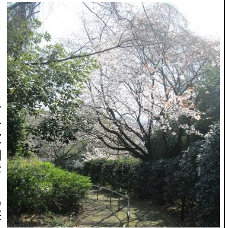
→魚見公園登り口の桜

魚見公園の桜もきれいです。大木の山桜がいくつもあり、ソメイヨシノとは違った美しさがあります。公園登り口の早咲きの白い桜は、3月17日にはもう満開でした。一番桜と言われているようです。