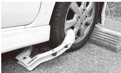
△タイヤロックされた自動車