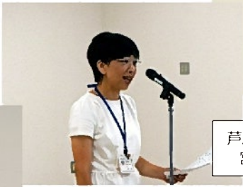
芦屋東小学校 宮村校長から激励のことは