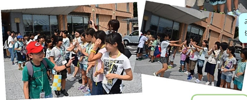
みんなに見送られて 佐野市を後にしました