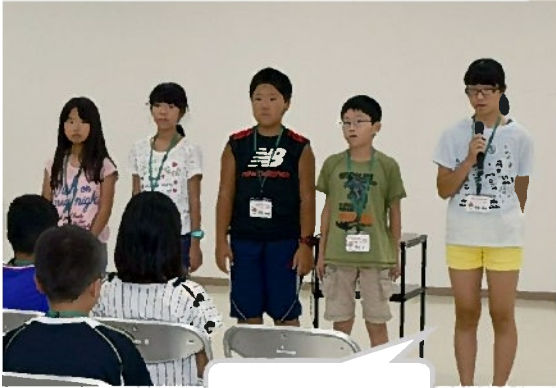
佐野市での目標は……

たくさんの来賓の方にきていただき、激励の言葉をいただきました。 研修生は自己紹介を行い、佐野市での目標や楽しみなことなどを発表しました。