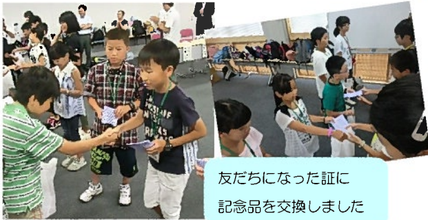
友だちになった証に 記念品を交換しました