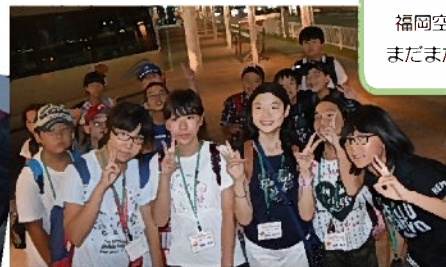
福岡空港に到着 まだまだ元気！？