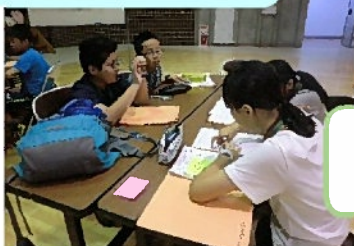
3日間を振り返って 発表内容を考え中