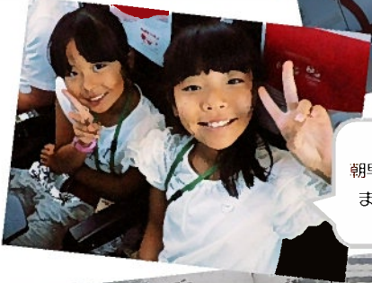
朝早くの出発でも まだまだ元気！