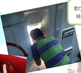
窓から何が 見える？