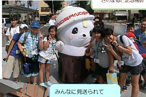
さのまと記念撮影！