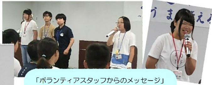
「ボランティアスタッフからのメッセージ」