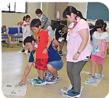
ハラハラ ドキドキ