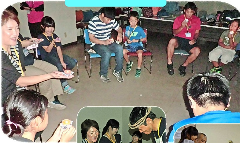
きれいな炎に うっとり♪