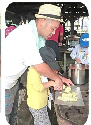
カレーライスづくり