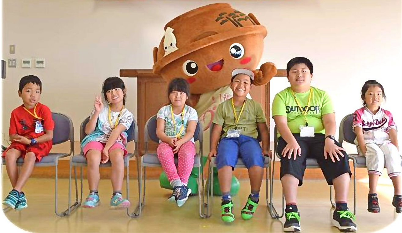
たくさんの事にチャレンジした2日間♪みんなで仲良く頑張りました!!