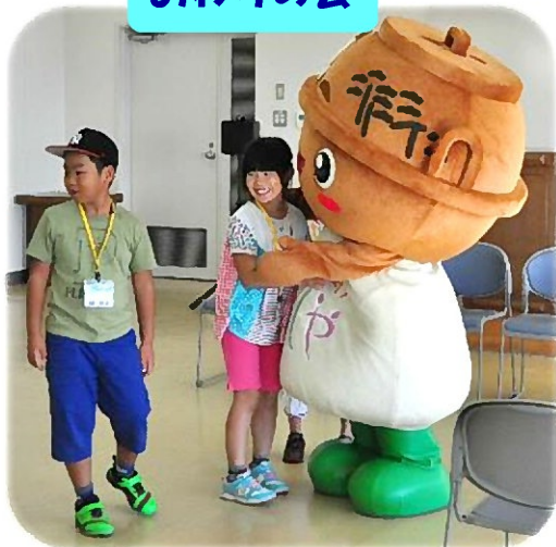
アッシーのお出迎えに大興奮◎