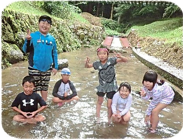
自然の中で思いっきり遊べたね!!