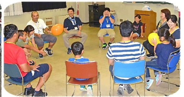
風船レクリエーション