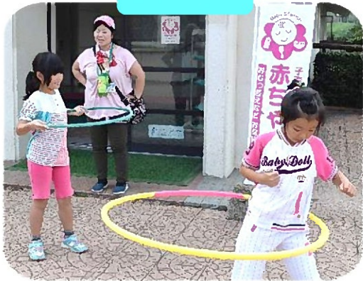
いろんな遊びにチャレンジ!!