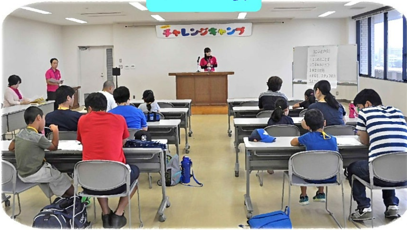
元気いっぱい 自己紹介♪