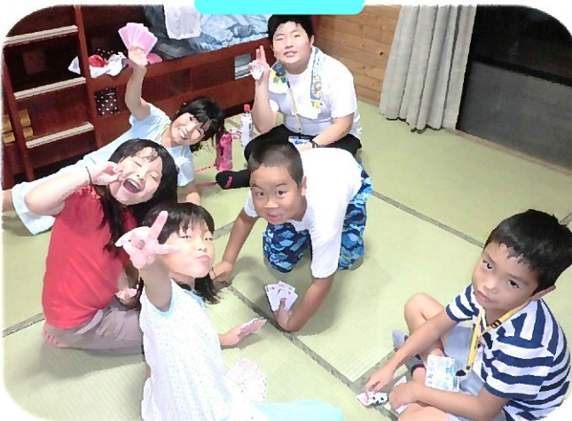
大盛り上がりのトランプ大会