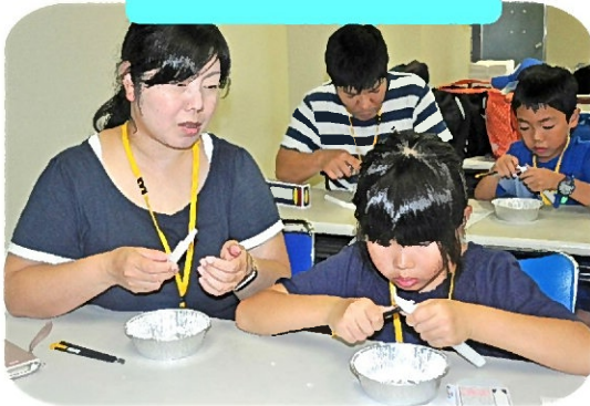
ろうそく 削りから スタート!! 世界に1つ のキャンド ルづくり