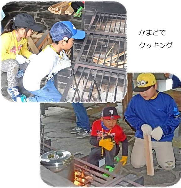
かまどで クッキング