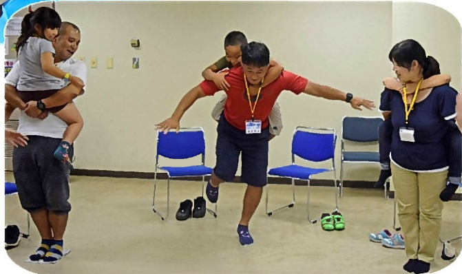
一致団結!! 魔法の じゅうたん