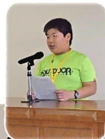
キャンプの感想を 発表してくれました★