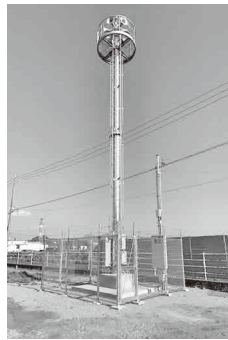
大城地区に新設したモーターサイレン施設

火災などの災害発生をお知らせするモーターサイレンは、平成30年度特定防衛施設周辺整備調整交付金事業により改修工事を完了し、施設の供用を開始しました。