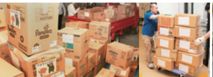
トラックへの積み込み準備