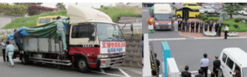
明和運輸(株)さんより、無償での運送にご協力いただきました