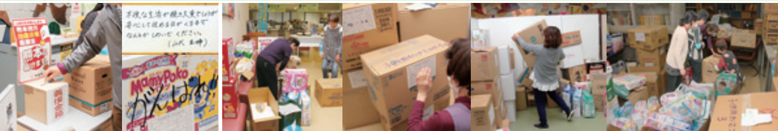
義援金の受け付け・応援メッセージ