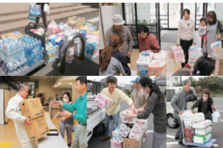
たくさんの救援物資を持ってきていただきました