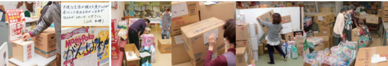
義援金の受け付け・応援メッセージ