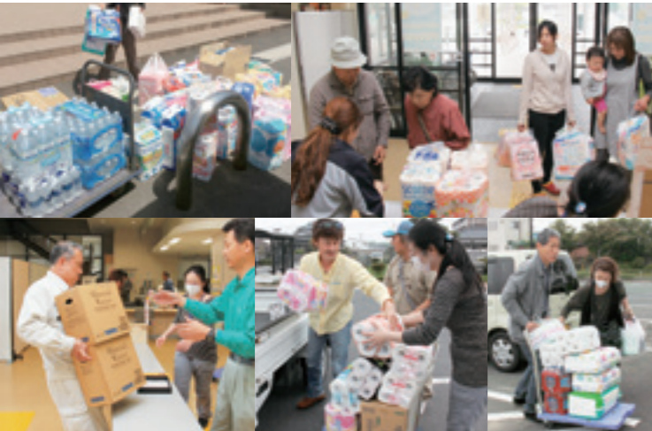
たくさんの救援物資を持ってきていただきました