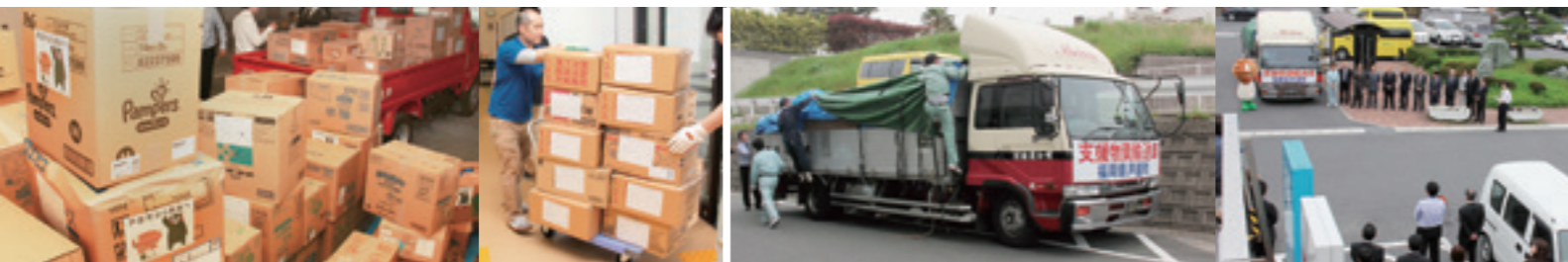
トラックへの積み込み準備