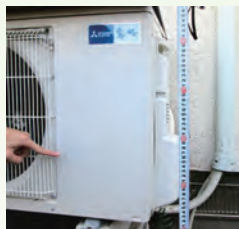
△屋外の浸水跡が分かる写真