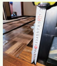
△屋内の浸水跡が分かる写真