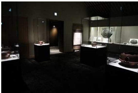
開館 30 周年記念特別展「芦屋釜の美と鋳物師の技」展示の様子