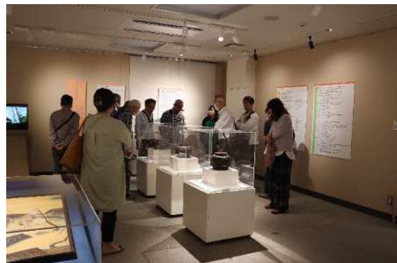
歴史民俗資料館特別展「金屋遺跡展」展示解説の様子