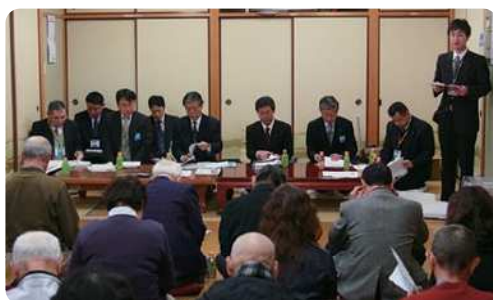
出前町長室の様子

芦屋町では、この『情報共有』をもとに、住民参画のための仕組みづくりに取り組んでいきます。