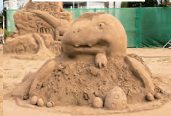
北筑高等学校美術部