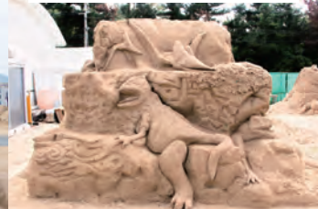
航空自衛隊芦屋基地交友会