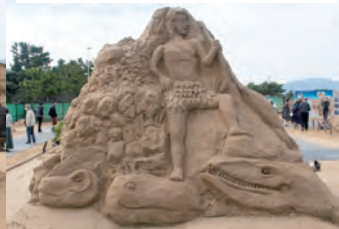
九州産業大学造形短期大学部