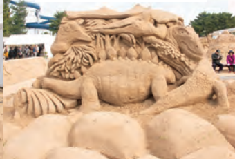
日本砂像連盟黒潮支部