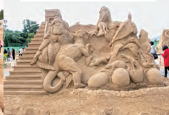
日本砂像連盟加世田本部