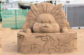
八幡南高等学校美術部