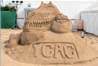
八幡中央高等学校芸術コース