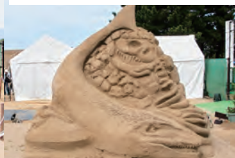
九州産業大学造形短期大学部