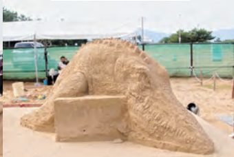
芦屋中学校美術部