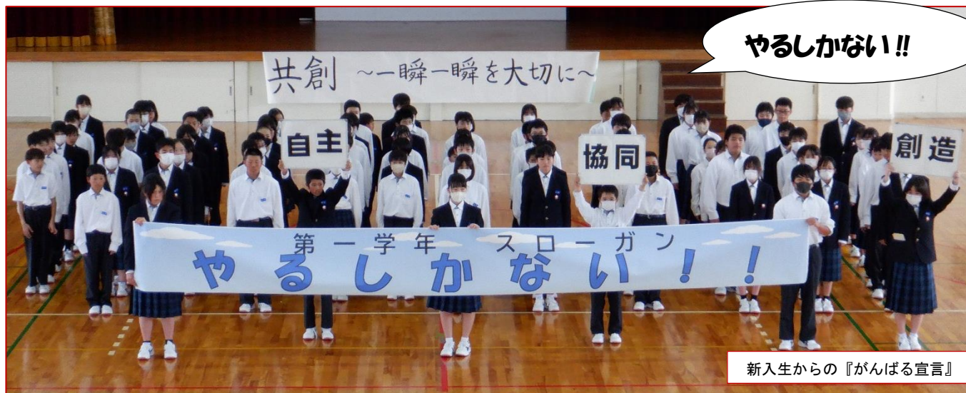
新入生からの『がんばる宣言』