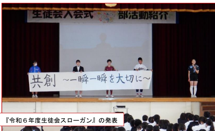
『令和6年度生徒会スローガン』の発表

『生徒会入会式』では、生徒会執行部から校訓や校旗、校歌の紹介、そして、令和6年度の生徒会スローガン『共創 ～一瞬一瞬を大切に～』が発表されました。また、各専門委員長から、委員会の活動内容の説明も行われました。