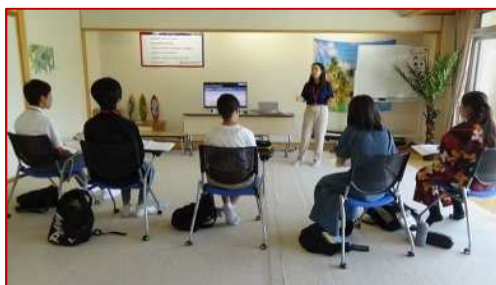
河口湖でのイングリッシュ・キャンプでは、日本語は使用禁止だった。