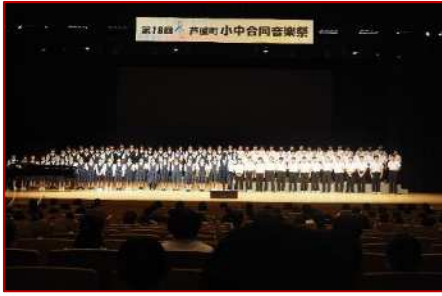
夢リアホールで小中合同音楽祭を実施し、各学校の絆を深めることができた。