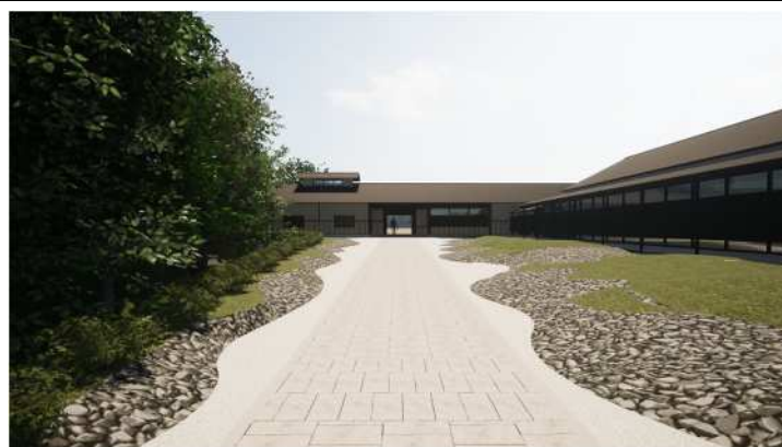
芦屋釜の里リニューアル後の 正面アプローチ（完成予想図）