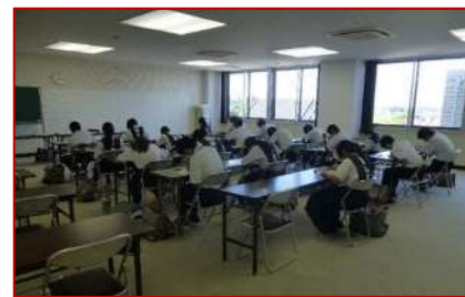
英語検定試験受験の様子