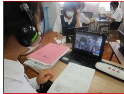
体験型英語学習で、外国人とオンラインで交流した。(中学校)