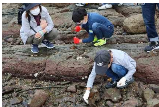
歴史民俗資料館「化石探検」の様子