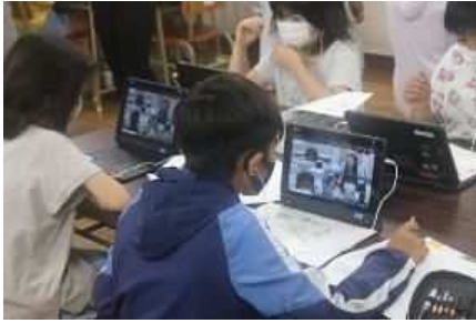
5・6年生児童が、国内に在住する6カ国の外国の方々とタブレットを使い、英語でやり取りする学習を行った。(小学校)