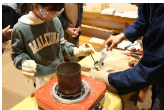
芦屋釜の里鋳物講座「古印づくり」の様子