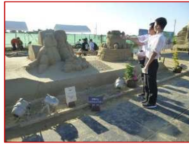
芦屋中学校美術部が制作した砂像を見学した。