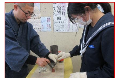
古印作り～型に錫を流す工程(3年生)