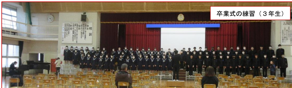
卒業式の練習(3年生)

伝統ある芦屋中学校では、これまで17,637名の卒業生に卒業証書が授与されてきました。そして、今年度も来週8日(金)に、《第77回卒業証書授与式》が行われ、3年生110名に卒業証書が渡されます。その《卒業証書授与式》にむけての準備が進められています。3年生は式の練習や、美術の授業時間に外部講師をお招きし、卒業制作として「錫製古印作り」に挑戦しました。