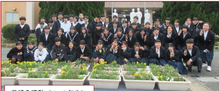
花植え活動(1・2年生)

また、1・2年生は美化委員会が中心となって、玄関前の花壇に「花植え活動」を行いました。さらに、来週は、生徒会が主催して3年生の思い出を振り返る『3年生を送る会』が企画されています。