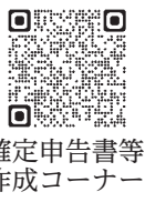
確定申告書作成コーナー

インターネットを利用できるパソコンやスマートフォンで所得税の確定申告書が作成できます。国税庁のホームページ「確定申告書作成コーナー」にアクセスし、画面案内に従って、収入金額などを入力するだけで簡単に作成できます。