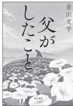
父がしたこと 青山 文平 著