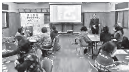
芦屋かるたを使った交流会

芦屋かるたを使って町の歴史を学ぶ交流会では、参加者が町の歴史を語り合いました。このように顔を合わせてつながりを作ることで、互いの様子を確認することができます。また、情報を共有し、気になる人への対応を行っています。