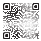
福岡県生涯現役チャレンジセンター

▽対象 おおむね60歳以上 ※履歴書は要りません。 ▽定員 各回50人(事前申し込み先着順) ▽参加費 無料 ▽申し込み 福岡県生涯現役チャレンジセンター オフィス(☎513・8188) 福岡県生涯現役チャレンジセンター