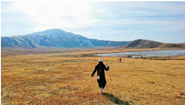
△はじめての九州旅行で景色のきれいさと食べ物の美味しさに感動し、九州のトリコになりました！

生まれてからずっと関西で過ごし、結婚を機に夫のゆかりの地である福岡への移住を検討、はじめて訪れた芦屋町で海のきれいさに一目惚れして移住を決めました。