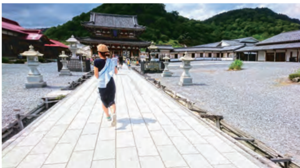
△女2人でレンタカーを借りて東北旅行へ。約2千kmを5日間で走りました！写真は憧れだった恐山です。