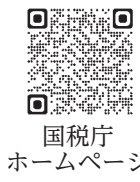
国税庁ホームページ