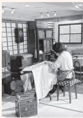
ミシンを使う風景※イメージ

突然ですが「ミシン」は何語だと思えますか。英語では「ソーイングマシン (sewing machine)」と呼ばれます。現在とほぼ同じ構造のミシンは、1850年にアメリカでドイツ系の血を引くアイザック・メリット・シンガー氏(後にシンガー社を設立)によって発明されていることからドイツ語でしょうか。いいえ、実は日本語なのです。ソーイングマシンの「マシン」の部分が変わり、「ミシン」となり、ミシンが登場した頃は「裁縫ミシン」が正式名称として使われていました。ミシンは、誕生から手回し式、足ふみ式、電動式と進化を遂げており、その進化には日本の技術力が大きく関わっています。現代でも日本のミシンブ