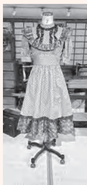
家庭用ミシンで製作したドレス

家庭用ミシンは、初心者の人でも扱いやすく多機能なミシンです。職業用ミシンや工業用ミシンとは異なり、さまざまな縫い方ができる点が最大の特徴といえます。ジグザグ縫いやボタンホール作り、布の種類に合わせた糸調子機能、刺繍機能を持つタイプもあります。そのため、家庭用ミシンは保育所、幼稚園などの入園グッズや小物、洋服づくりなどに、家庭で裁縫を楽しみたい人に適したミシンです。家庭用ミシンは大きく分けて、電動ミシン、電子ミシ