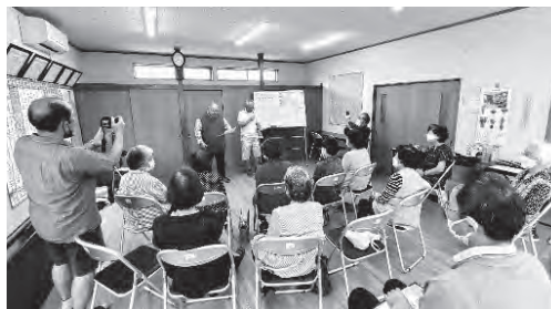
敬老会で地域の人が漫才を披露

交流会を行い、地域の住民が集まり、顔を合わせることで、つながりを作っていきます。公民館まで来られない人は、要見守り配慮者として、遠くから見守りつつ、必要があれば自宅を訪問し、体調の確認をすることもあります。