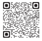
遠賀・中間地域広域行政事務組合

○待合室利用者の茶器類配膳、片付け ※応募要件は、遠賀・中間地域広域行政事務組合のホームページを確認してください。 遠賀・中間地域広域行政事務組合