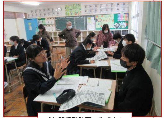
「年間活動計画」作成中！