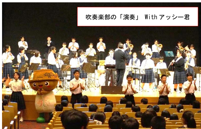
吹奏楽部の「演奏」 With アッシー君

午前中の『文化祭』では、各学級・学年の合唱が行われ、夢リアホールの素晴らしいステージでどの学級・学年も素敵な歌声を響かせてくれました。また、午後からの『小中合同音楽祭』では、特に3年生が「さすが3年生!」と貫禄を示すハーモニーを披露してくれました。さらに、生徒会によるオープニングや吹奏楽部の演奏では、アッシー君も登場し、大いに会場を盛り上げ沸かせてくれました。