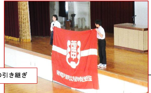
“伝統”の旧生徒会長から新生徒会長へ生徒会旗の引き継ぎ