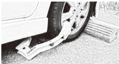
△タイヤロックされた自動車