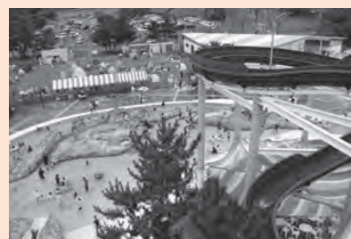
レジャープールアクアシアン