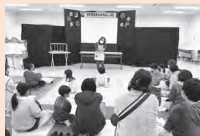
図書館特別おはなし会