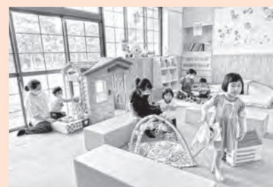
子育て支援センター