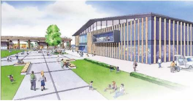
芦屋港イメージパース （全天候型施設と1号上屋複合施設）