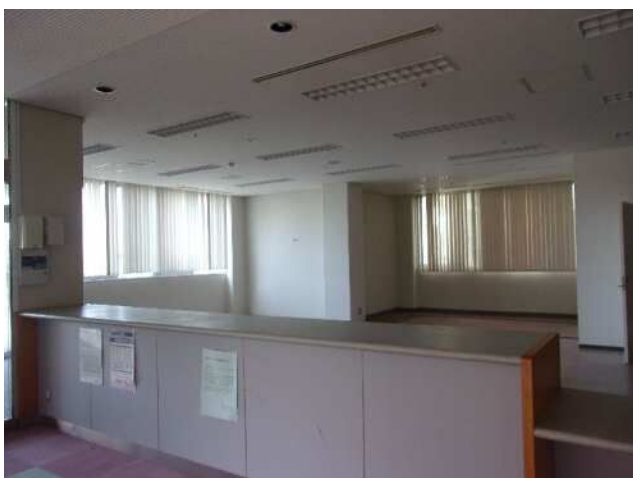
1F 新館玄関付近ホール