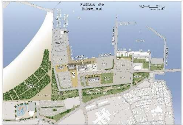
施設配置図 （配置は変わる可能性があります）