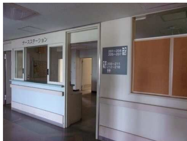
2F ナースステーション