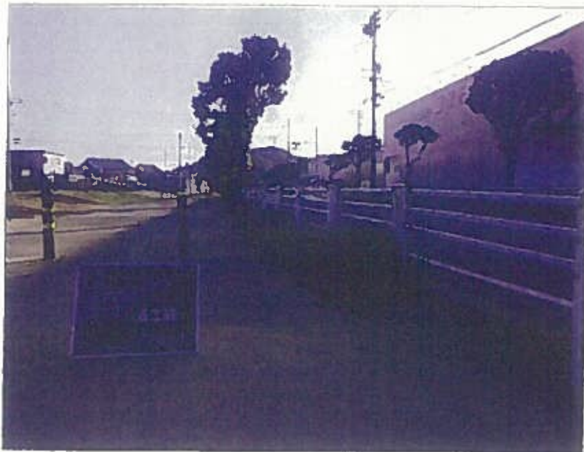
樹木管理 除草工 着工前 令和2年10月26日