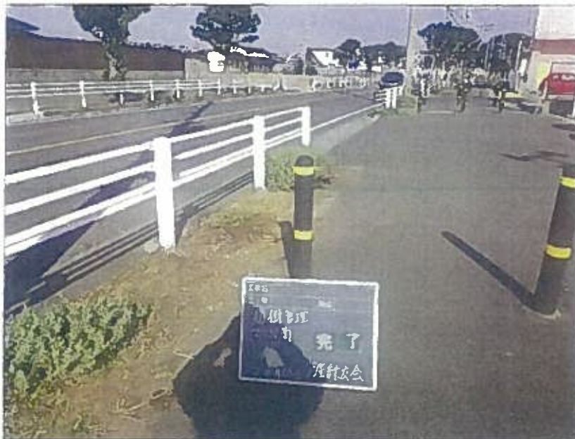
樹木管理 植栽工 完了 令和2年10月26日