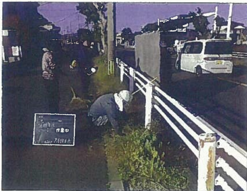
樹木管理 除草工 作業中 令和2年10月26日