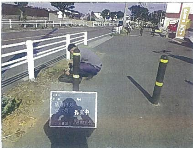
樹木管理 植栽工 作業中 令和2年10月26日