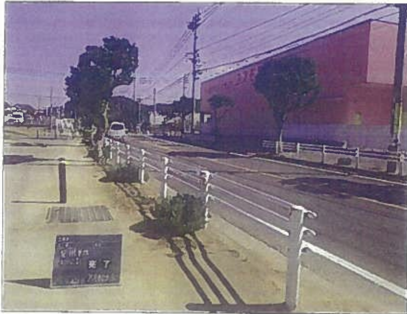
樹木管理 除草工 完了 令和2年10月28日