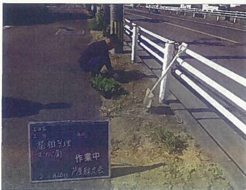
樹木管理 植栽工 作業中 令和2年10月26日