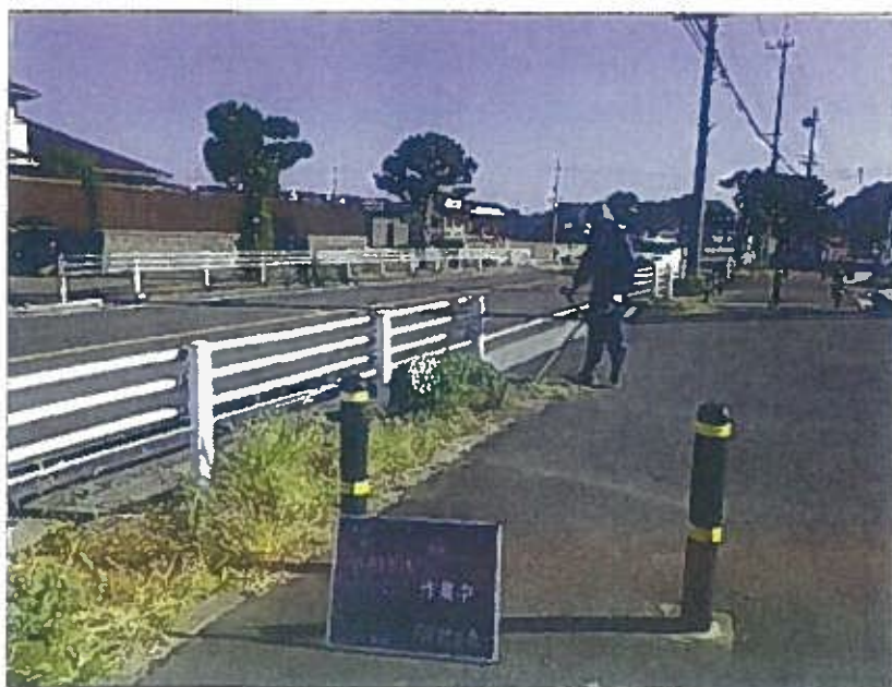
樹木管理 除草上 作業中 令和2年10月26日