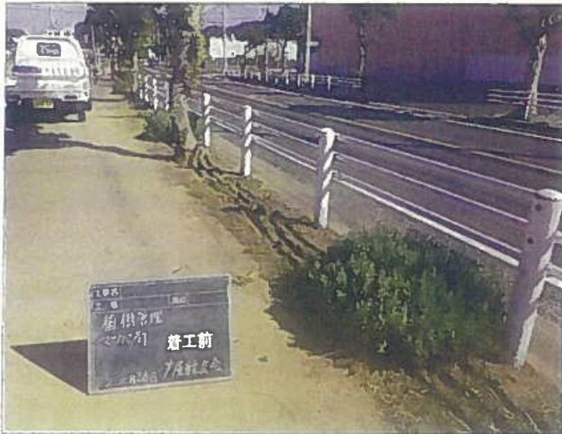
樹木管理 植栽工 完了前 令和2年10月26日