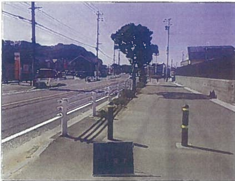
樹木管理 除草工 完了 令和2年10月26日