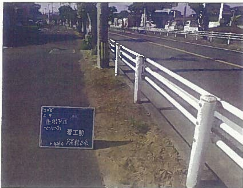
樹木管理 植栽工 着工前 令和2年10月26日