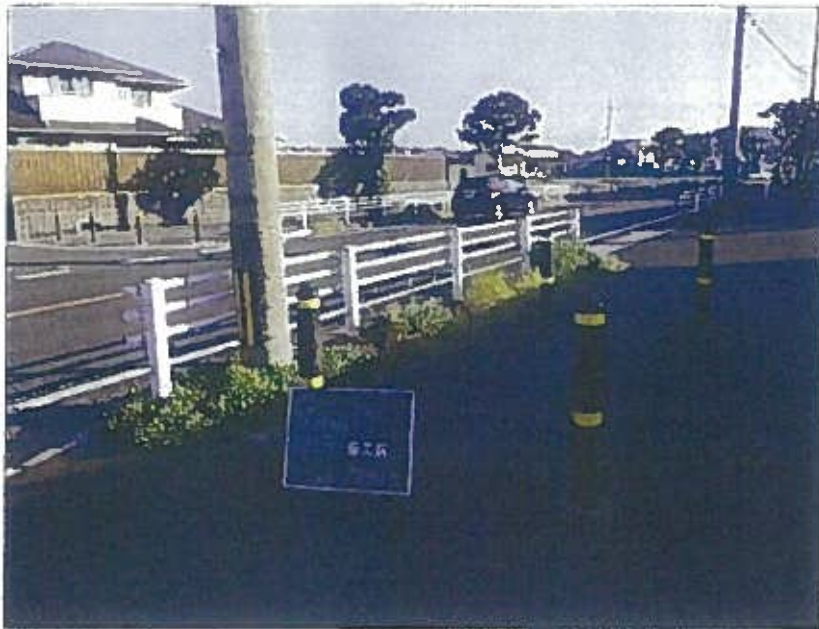
樹木管理 除草上 善工前 令和2年10月26日