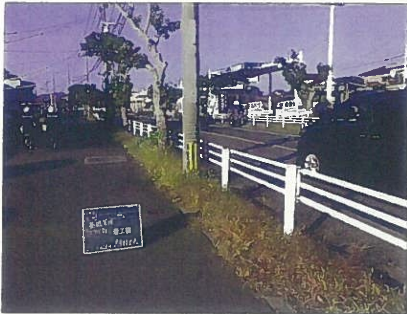
樹木管理 除草工 着上前 令和2年10月26日