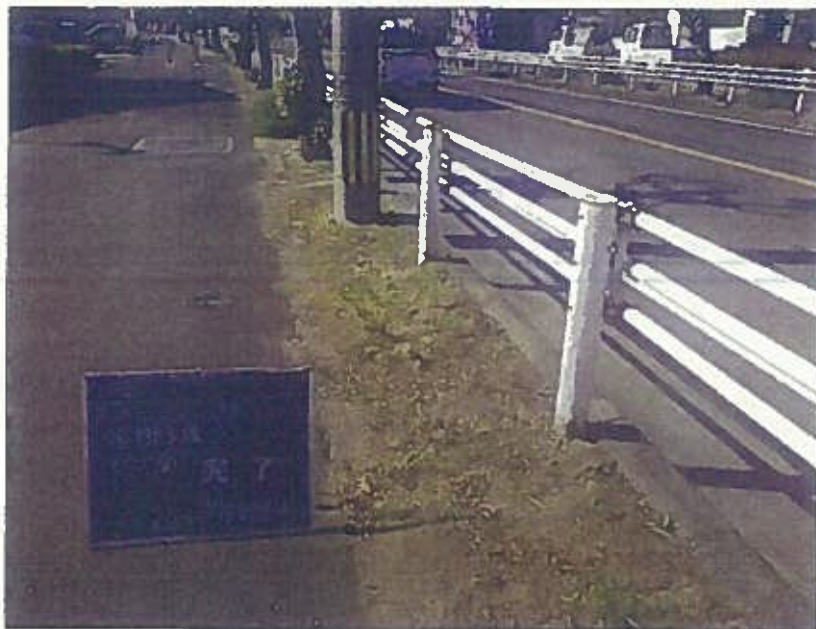
樹木管理 植栽工 完了 令和2年10月26日