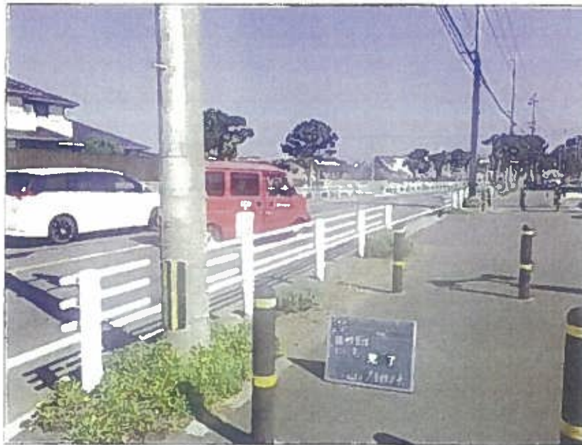
樹木管理 除草上 完了 令和2年10月26日