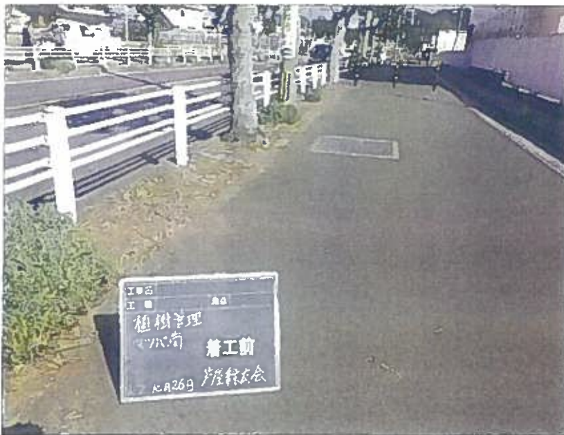
樹木管理 植栽工 着工前 令和2年10月26日