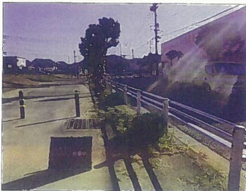
樹木管理 除草工 作業中 令和2年10月26日