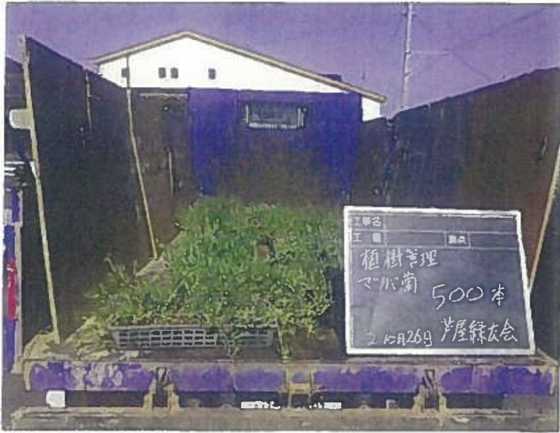
樹木管理 植栽工 材料検収 令和2年10月26日