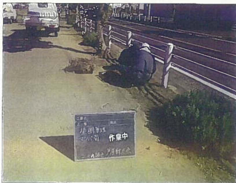
樹木管理 植栽工 作業中 令和2年10月26日