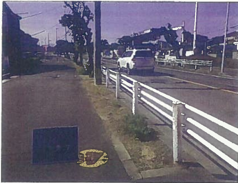
樹木管理 除草工 完了 令和2年10月26日