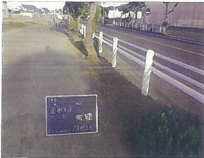
樹木管理 植栽工 完了 令和2年10月26日