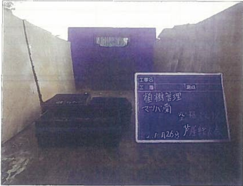
樹木管理 植栽工 空箱検収 令和2年10月26日