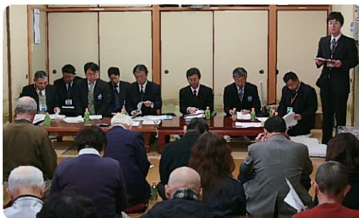
出前町長室の様子

芦屋町では、この『情報共有』をもとに、住民参画のための仕組みづくりに取り組んでいきます。