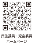
民生委員・児童委員ホームページ