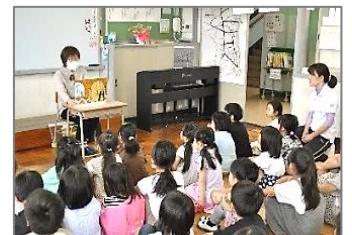
お話の中に入り込んでいます

右写真は、身を乗り出してお話を聞いている1年生の様子です。絵本の力はすばらしいですね。また読み手の方との信頼関係も深まり、次回の読み聞かせの日を待ち遠しくしている子どもが多くいます。1学期間、子どもたちのために温かい時間をつくってくださりありがとうございました。2学期も楽しみにしています。どうぞよろしくお願いいたします。