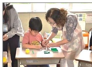
上四元先生とカレンダーづくり