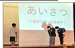
『3つのあ』の実践(児童会企画)