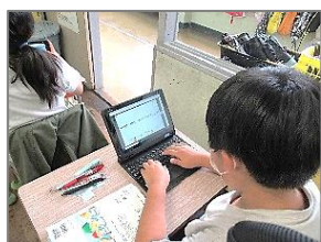
じっくり自分の考えを構築中

学習指導要領の理念である「生きる力を育む」ことを目指すにあたり、各教科等、学校の教育活動全般を通して「知識・技能の習得」「思考力・判断力・表現力の育成」「学びに向かう力、人間性等の涵養」の実現を求めています。明日、持ち帰る