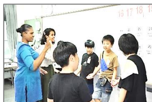
Let's enjoy English! (ALTとの対面交流会)

通知表は、どの教科もこの3つの観点をもとに評価したものになります。また、学習指導要領総則に出てくるキーワードの一つに「健康で安全な生活」があります。例として、熱中症予防や感染の対策一つをとって