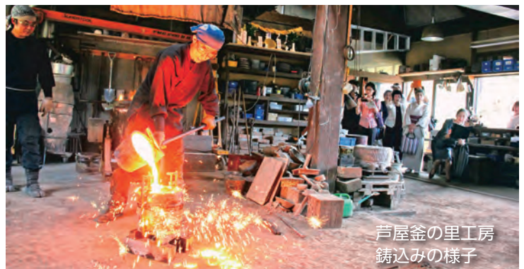
芦屋釜の里工房 鋳込みの様子