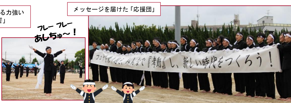
メッセージを届けた「応援団」