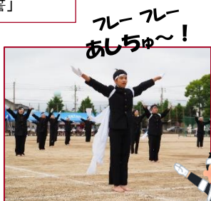
フルフルあしちゅ〜!