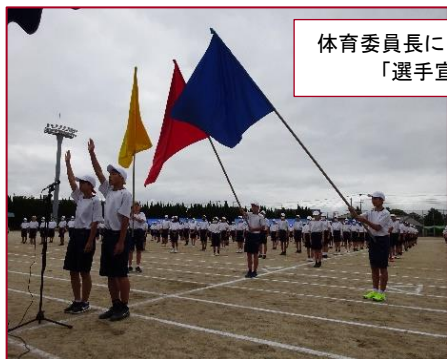
体育委員長による力強い「選手宣誓」

5月20日(土)、4年振りに入場者制限が解除され、多くのご来賓や保護者、地域の方々の観戦のもとで、「体育大会」を行いました。吹奏楽部のファンファーレで始まり、「ブロックスローガン」や「部活動行進&対抗リレー」が復活するなど、『コロナを乗り越え、新しい時代を創っていこう』とする意気込みが感じられる体育大会となりました。