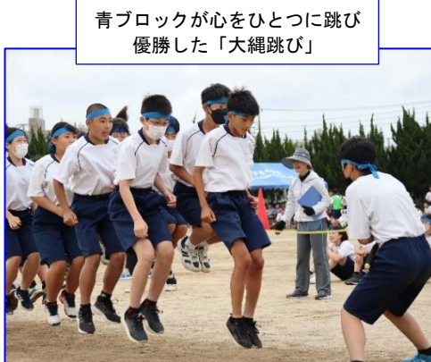
青ブロックが心をひとつに跳び優勝した「大縄跳び」