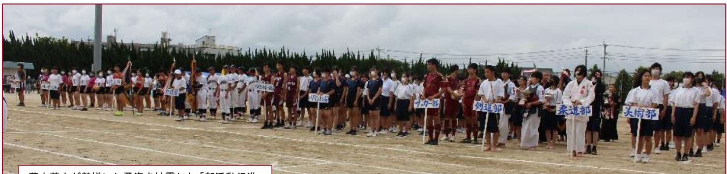
芦中若人が勢揃いし勇姿を披露した「部活動行進」