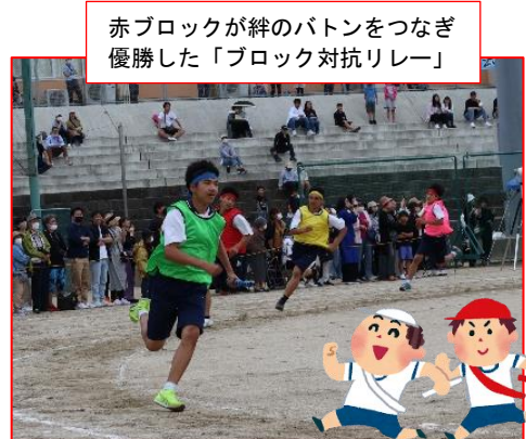
赤ブロックが絆のバトンをつなぎ優勝した「ブロック対抗リレー」