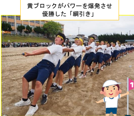
黄ブロックがパワーを爆発させ優勝した「綱引き」