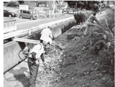
△庭の樹木のせん定や掃除など活動の様子