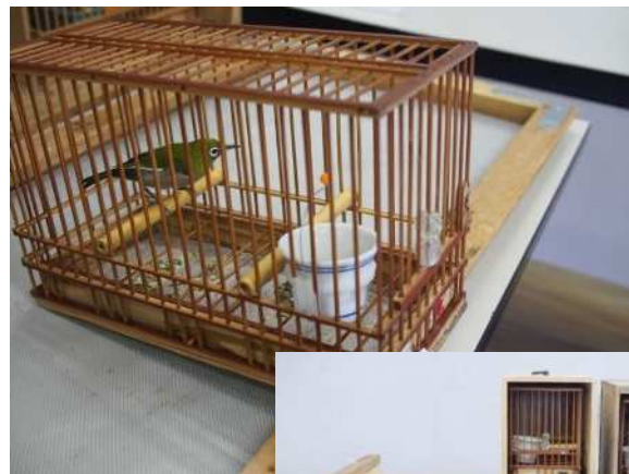
警察に押収されたメジロ