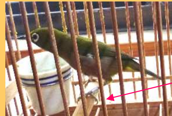
飼養登録を受けたメジロ