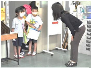
入室の仕方を2年生が優しく教えていました

1・2年生が、生活科の学習の一環として「学校たんけん」を行いました。1年生のめあては、芦屋小学校にはどんな教室があるのかを実際に見に行き知ることです。2年生のめあては、1年生と一緒に学校を回り、いろいろな教室を案内して説明する体験を通し、2年生としての自覚を高めることです。1年生と2年生の交流は、これが初めてとなります。体育館に集まり「これから学校探検を始めます。」の言葉で、学校探検をスタートしました。