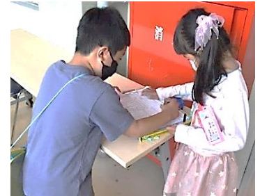
スタンプラリー たくさんたまったね!