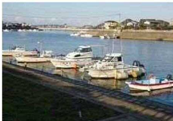
写真 芦屋港周辺（遠賀川河口域）の不法係留船の様子