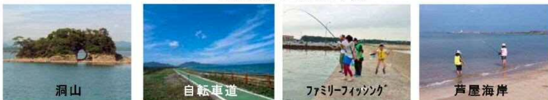
写真 芦屋港とその周辺における主な観光地