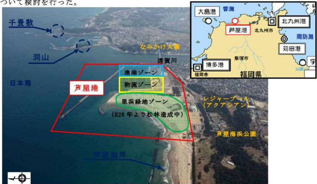
図 1 業務対象地域周辺写真

このような状況を踏まえ、本調査では今後の北九州地域における水辺空間を活かした地域創生による芦屋町並びに芦屋港周辺地域の活性化を図ることを目的に、産業・観光需要を踏まえた利活用の検討、地域活性化に資する基盤整備の検討、PPP/PFIを用いた施設整備の可能性等について検討を行った。