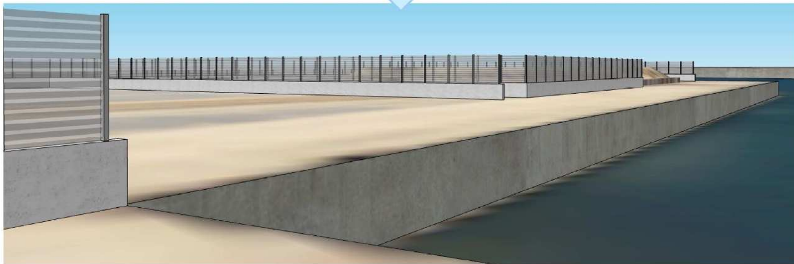
イメージパース図