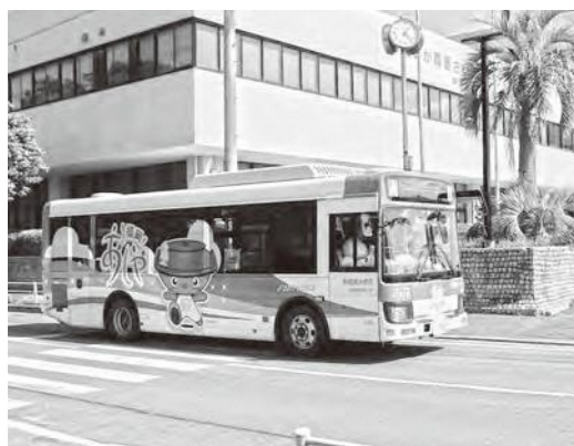
町内を走るタウンバス