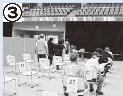
診察や接種前待機