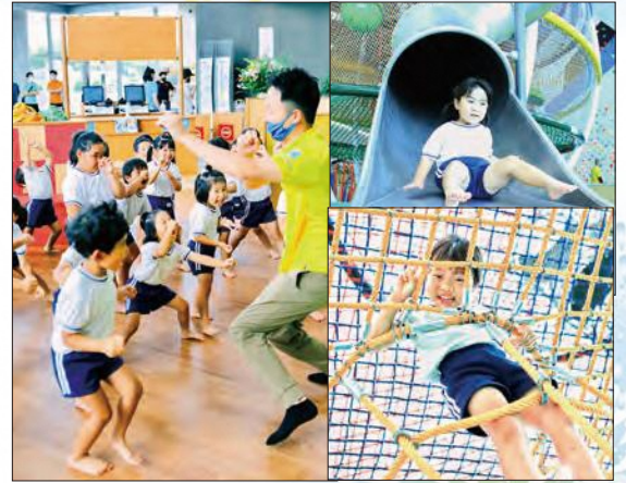
モーヴィで遊んだ園児たち

Q モーヴィで遊んでみて、何が一番楽しかったですか？ A 中に入れるやつで、友達とぐるぐる回ったのが楽しかった。（表紙に写っているサイバーホール）