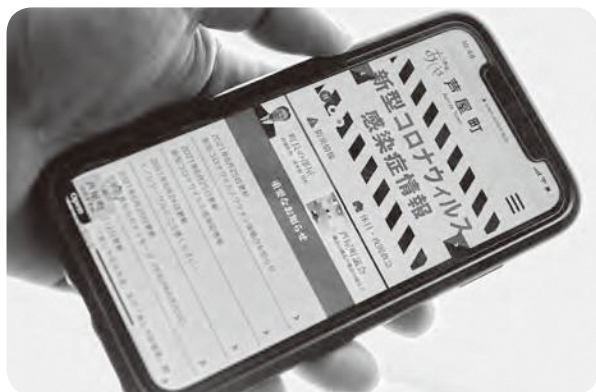
スマートフォンで見る芦屋町のホームページ

答 若い世代から高齢世代まで多くの住民に、わかりやすく適切なタイミングで必要な情報が伝わるよう努めたい。