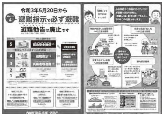
避難勧告が避難指示に一本化されたことを周知するチラシ

答 ハザードマップを確認し、さまざまな状況への対応を自主防災組織で考えてもらう。今年度、はまゆう区では出前講座を行い、柏原区まちづくり委員会では災害対応の協議を重ね、各地域の状況に応じた災害支援対策を行っていく。