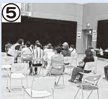
経過観察で一定時間待機