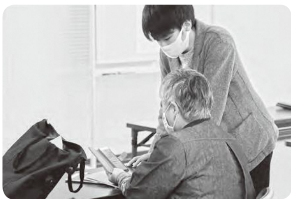
スマホ・タブレット活用講座の様子

答 現行の講座の実績や課題を分析し、国の概要を踏まえて、内容などの拡充を検討する。