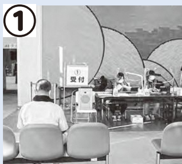
受付での検温や本人確認