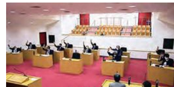
録画中継で見た表決の様子

詳しくは、芦屋町ホームページをご覧ください。なお、配信は本会議終了から7日後（土日祝日のぞく）になります。