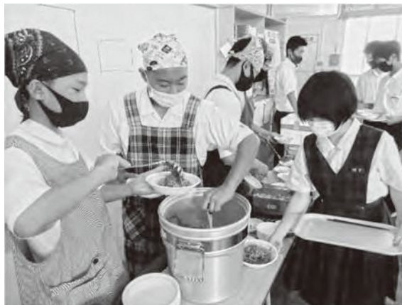
中学校の給食の様子

討論とは自分の考えに反対する議員や賛否を決めかねている議員に対し、賛同してもらうために意見を表明することです。