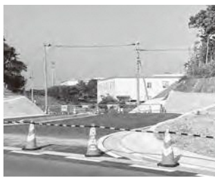
芦屋・青葉台線（芦屋側）

答 6月末に北九州市側の工事が完了する。その後、北九州市が道路用地の確定測量や分筆登記の作業を行い、8月中に開通する予定。