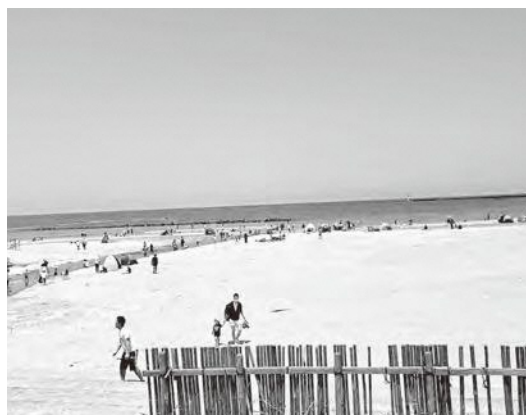
聞き取り調査を行う予定の芦屋海岸