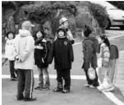
毎朝見守ってくれる人たちと、元気にあいさつ