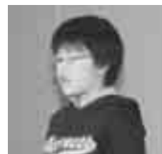
本番では、しっかりと発表できました