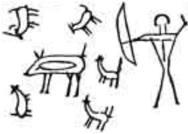
銅鐸に描かれた 猪を追う5頭の犬の図

犬は害をなさないばかりか、 耳が鋭く、わずかな物音にも うなり声をたてるため、番犬 としての価値を見出されまし た。さらに臭覚も鋭く、にお いでかくれた獲物を探し出し、 狩りの補助ができる狩猟犬と しての性格が認められました。 人間は子犬から育てることで、 最初の家畜犬を手に入れたの です。