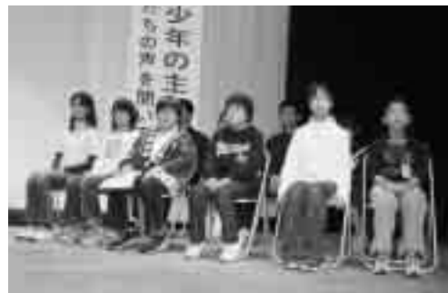
発表前は緊張気味でしたが