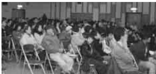
発表者の意見に、多くの人たちが耳を傾けました