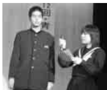
インタビューも、ばっちり！

私たちの声を聞いてよ ～青少年の主張大会～ 昨年の12月10日、町民会館大ホールで、第12回青少年の主張大会がありました。町内の小・中学生10人と高校生1人が、自分が考えていることや感じていることを、堂々と発表しました。 ここでは主張大会の様子や、発表者からのメッセージを紹介します。