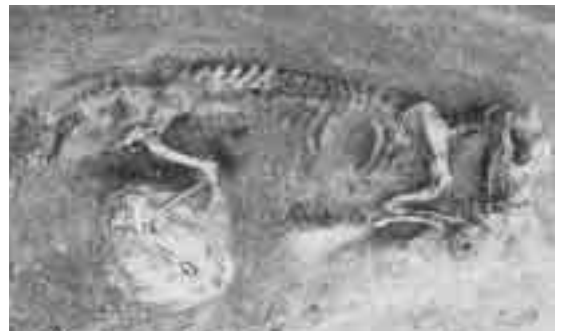
山鹿貝塚から出土した縄文犬の骨

文犬と思われる犬の骨が出土 しています。6歳前後の成犬 だと思われませんが、この犬の 特徴は歯がすり切れているこ とだそうです。おそらく、獣骨 を与えられていたか、かなり 硬い物を噛み潰していたもの と考えられます。大きさは肩 の高さが推定37cm、今なら柴 犬くらいの小型にあたるそう です。山鹿の縄文人はごちそ うは与えなかったかもしれま せんが、人間と同じように丁 重に葬ったところから見ると、 かわいがって育てられていた のでしょう。