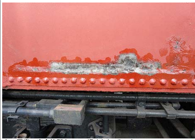
左の写真の腐食箇所をFRPで埋めたところです。