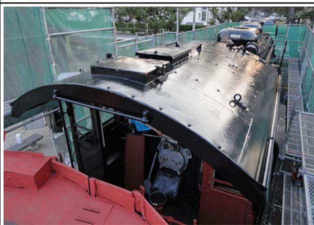
屋根の黒ペイントが完了したところです。