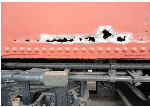
続いて、炭水車の修繕を行います。