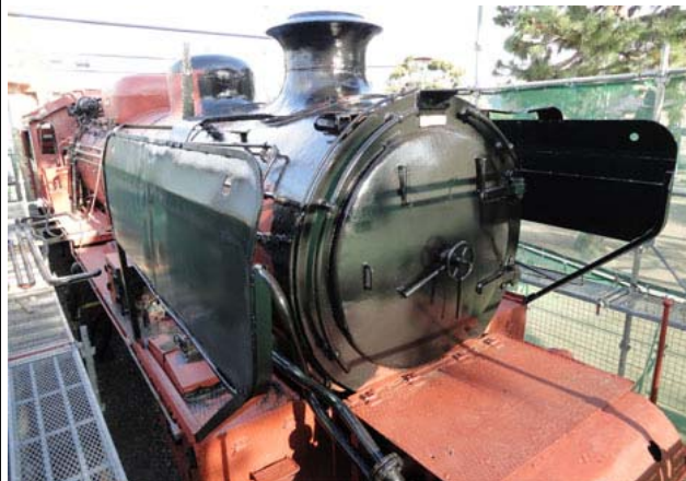
小工式デフレクターに黒ペイントを行っていきます。