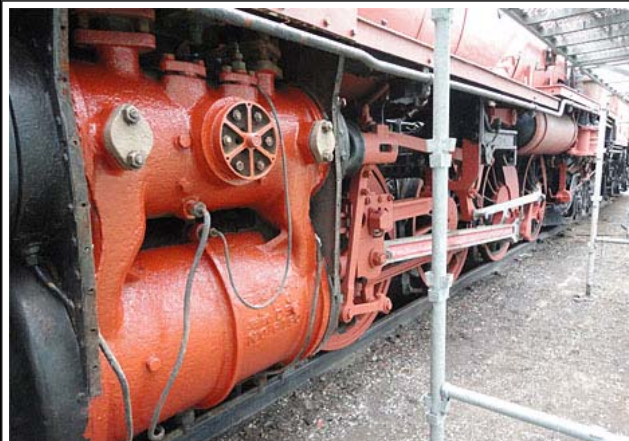
足回りも修繕を進めていきます。