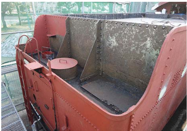
炭水車の修繕状況です。