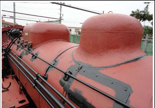
水漏れ対策は今後の保存状態にかかわりますので、コーキング剤を使ってしっかり行います。