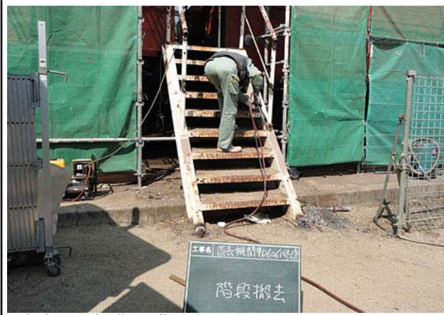
運転室へ上がる階段の撤去状況です。