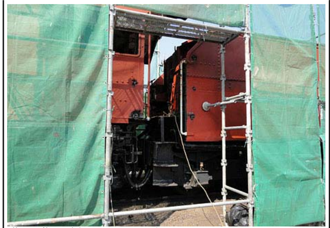
階段の撤去が完了したところです。