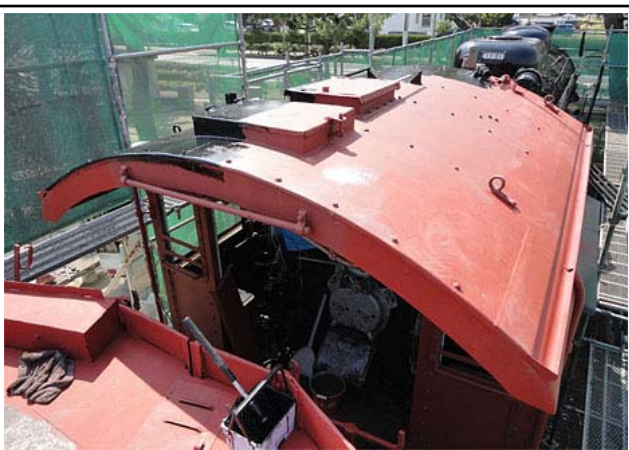
運転室の屋根を黒ペイントしているところです。