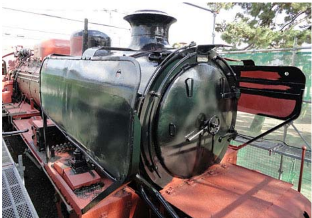
機関車も黒ペイントを施していきます。