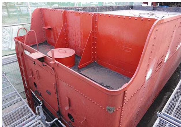
さびを落とし、さび止めを塗装していきます。