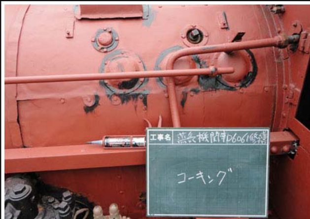
コーキング剤で、水の進入を防ぎます。

今月上旬は、コーキング剤を使っての水漏れ対策、シリンダーカバーの取り付け、階段の撤去、そして炭水車の修繕等、進めていきました。