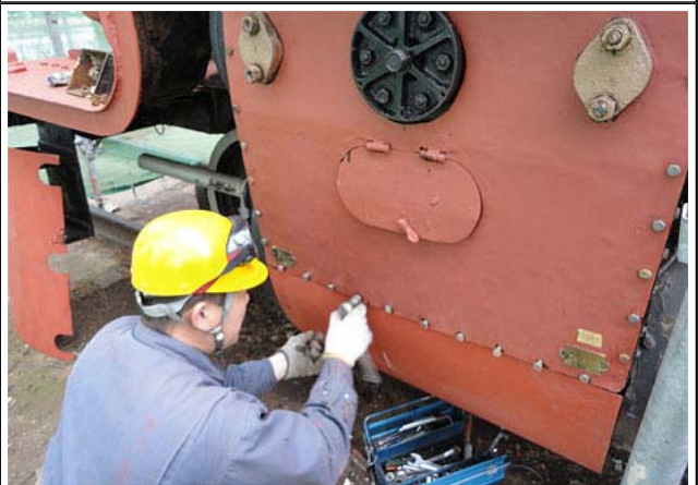
D6061にシリンダーカバーを取り付けているところです。